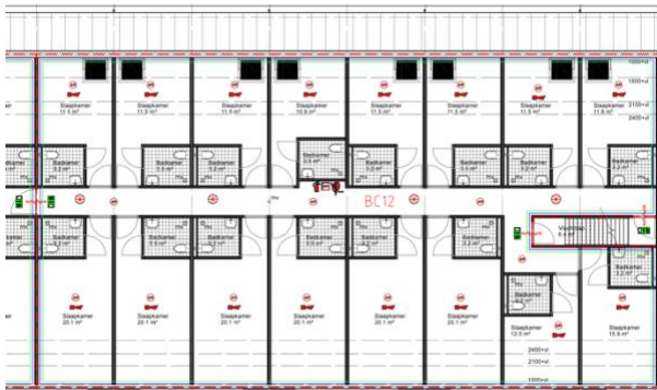
Figuur 1 Deelplattegrond slaapkamers eerste verdieping

Een langwerpig voormalig agrarisch gebouw wordt herbestemd tot een gebouw voor tijdelijke huisvesting van arbeidsmigranten. Na verbouwing bestaat het gebouw uit drie bouwlagen waarvan de begane grond en de eerste verdieping worden ingedeeld in slaapkamers, elk met eigen sanitaire voorzieningen. Daarnaast wordt voorzien in een aantal gemeenschappelijke ruimtes. In een aantal daarvan zijn voorzieningen opgenomen om te koken. In totaal zijn er 89 slaapkamers, bedoeld voor het gelijktijdige verblijf van ten hoogste 166 personen. Hieronder is de principe-opzet van het gebouw weergegeven in de figuren 1 en 2.