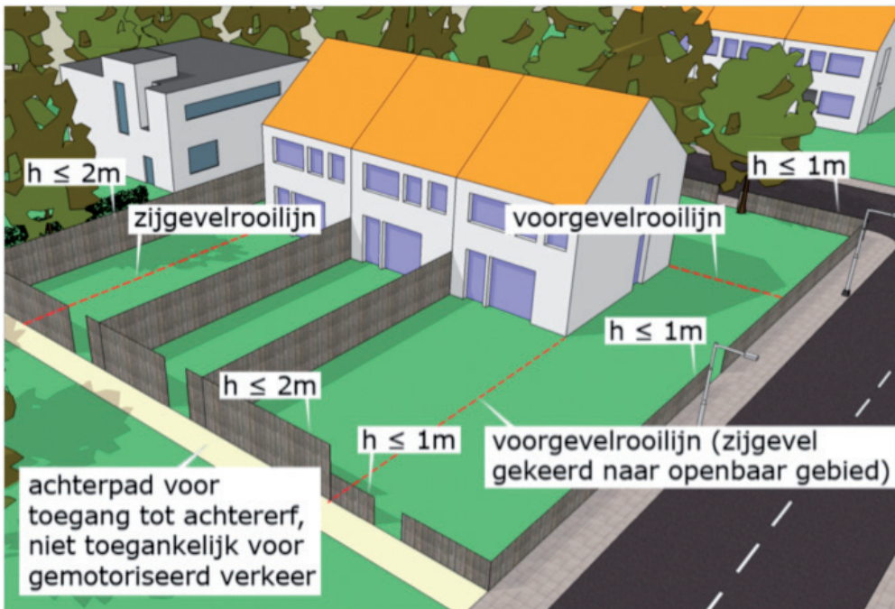
De tekening laat zien in welke gevallen een erfafscheiding zonder omgevingsvergunning mag worden geplaatst

Voor de voorkant (vóór de voorgevelrooilijn) gelden aparte maatstaven. De afscheiding mag tot 1 meter hoogte zonder omgevingsvergunning worden geplaatst. Wilt u vóór de voorgevelrooilijn een afscheiding plaatsen die hoger is dan 1 meter, dan moet u hiervoor een omgevingsvergunning aanvragen. Bij een hoekwoning wordt ook de zijgevel die gericht is naar het openbaar gebied gezien als voorgevelrooilijn.